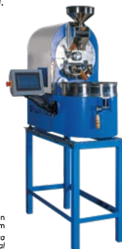
Iron base is an optional item La base metálica es un ítem opcional

Este tostador tiene un sistema integrado que permite alternar durante el tueste, la conducción y la convección térmica. Disponible en la versión para 2 Kg por tueste.